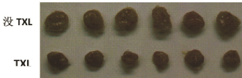
肿瘤体积 (cm 3 )